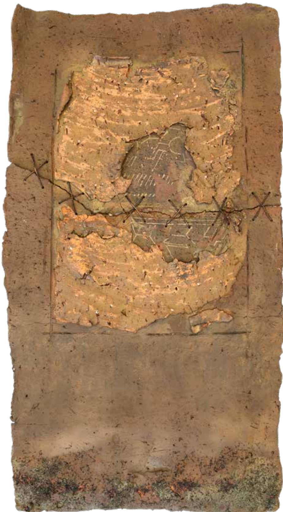
Pompeo Pianezzola, Pagina cucita , 1985. Collezione privata.