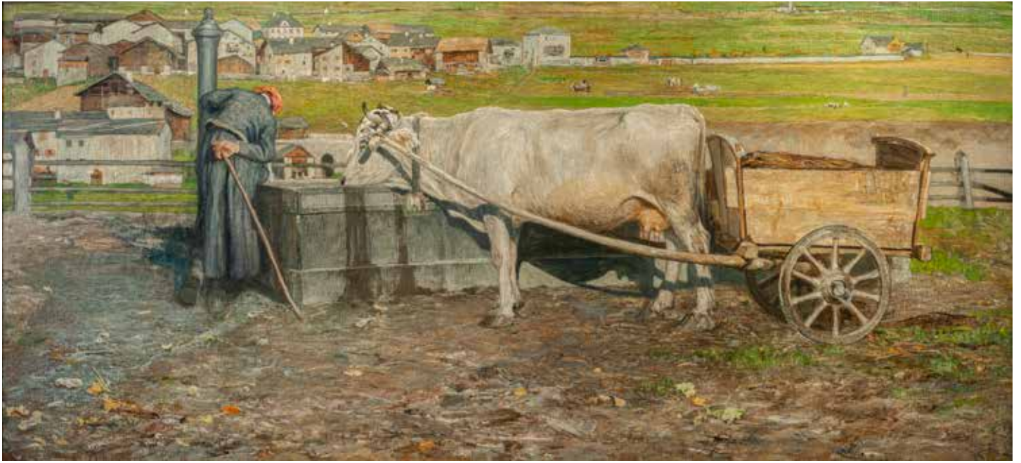
Giovanni Segantini, Sole d'Autunno , 1887. © Comune di Arco, Galleria Civica G. Segantini