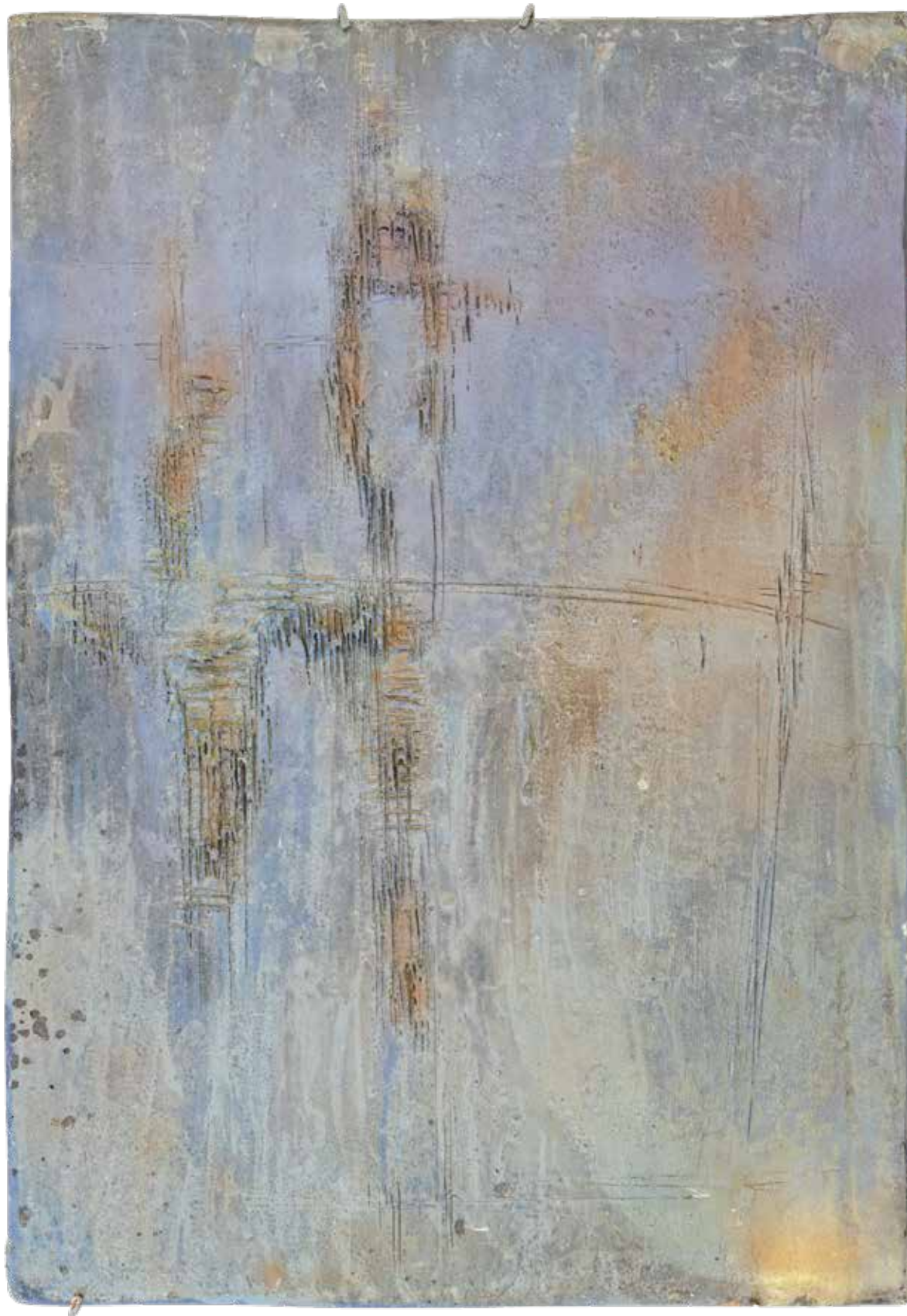
Pompeo Pianezzola, Paesaggio , 1960. Collezione privata.