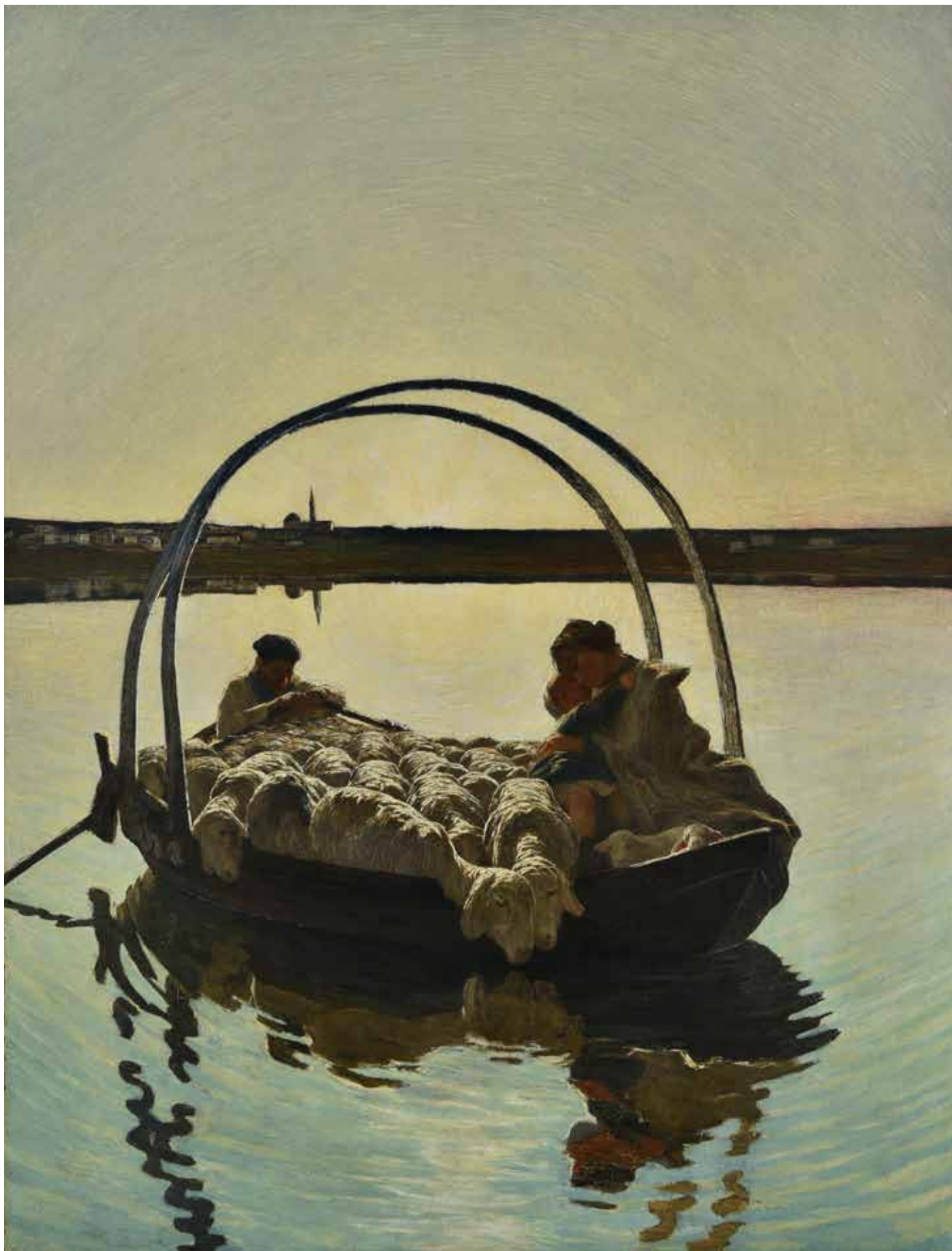
Giovanni Segantini, Ave Maria a trasbordo , 1887.