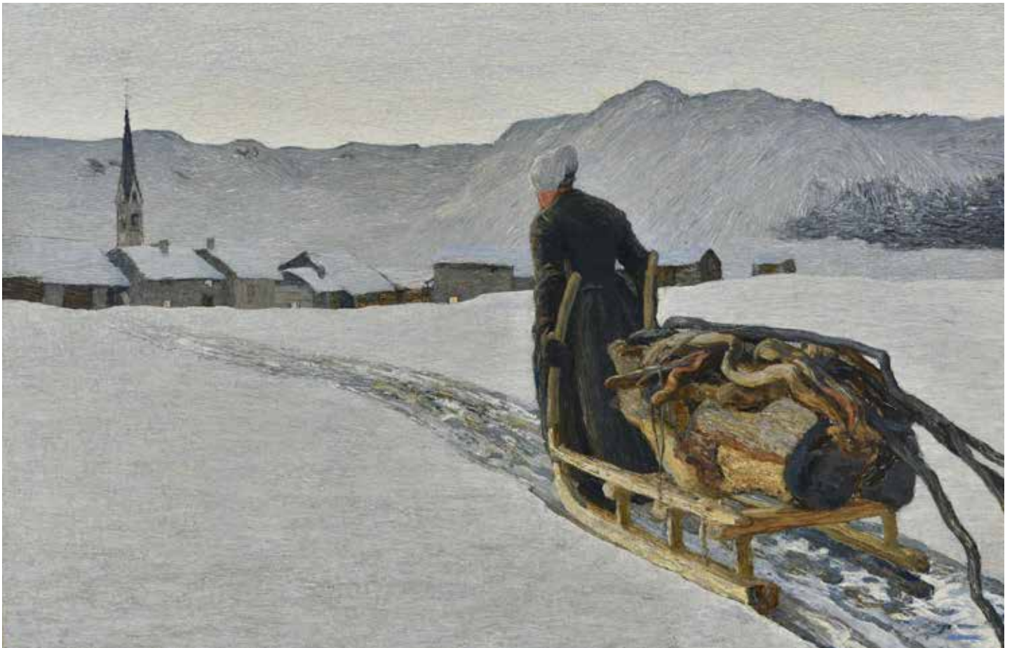
Giovanni Segantini, Ritorno dal bosco , 1890.